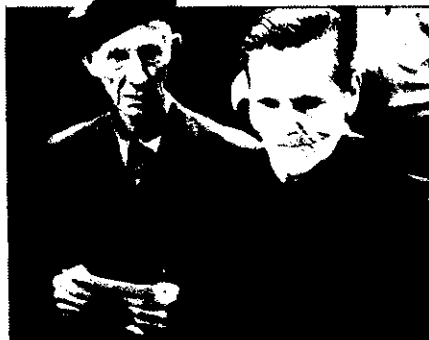
Los ancianos suelen ser los más madrugadores para ir a votar

Lo decimos en portada y lo volvemos a repetir. El Barcelonés Nord ha resultado ser, en virtud de los porcentajes de los resultados electorales, más felipista que otras zonas. Santa Coloma se llevó la palma de felipismo, con un 71,39% de votos socialistas, mientras que Tiana, más discretamente, arroja un 40,32%. En cuanto a segundos puestos, la competencia se da entre Convergència i Unió y Alianza Popular.