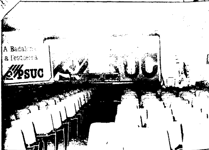
La gent del PSUC, abatuda per la derrota, varen abandonar aviat el seu centre de dades.