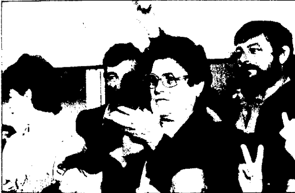
Con el transcurrir de las horas aumentó la alegría en el local del PSC-PSOE