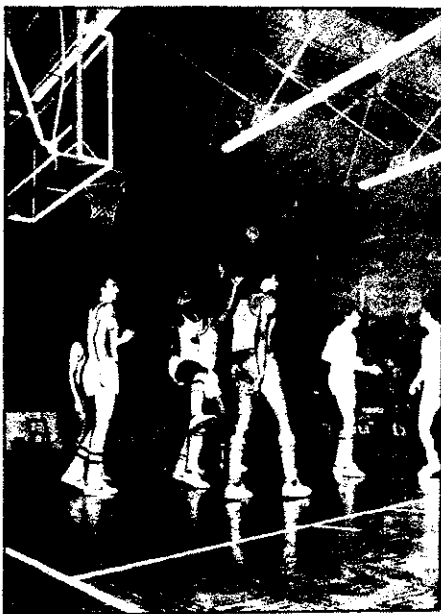
El Cotonificio buscará un buen resultado en Ferrol, ante el OAR, que no es un equipo fácil en su terreno.

Es la primera vez que Santa Coloma organiza un acto de estas características y volumen de un deporte aun minoritario en la ciudad como es el tenis de mesa.