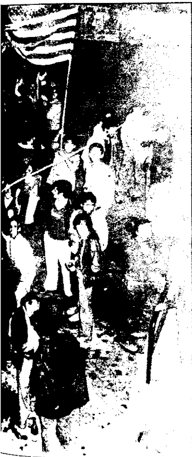
Se van espigar, a la Plaça de la Vila de Badalona