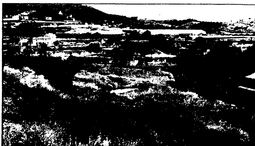
Los terrenos ahora inactivos serán ceder los hortícolas y verduras.

Los vecinos que se encontraban en la Sala de Plenos se preguntaban si el proyecto de los huertos se podrá llevar a cabo o no a la vista del informe del arquitecto municipal. Fue bien, esta misma pregunta la formuló GRAMA a las personas que