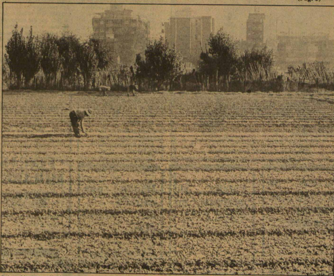
Labrar el huerto: pasión de muchos ciudadanos urbanos